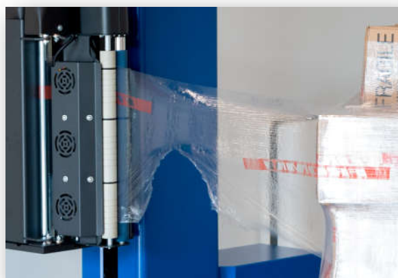
Coupe automatique du film, fin du cycle d'emballage